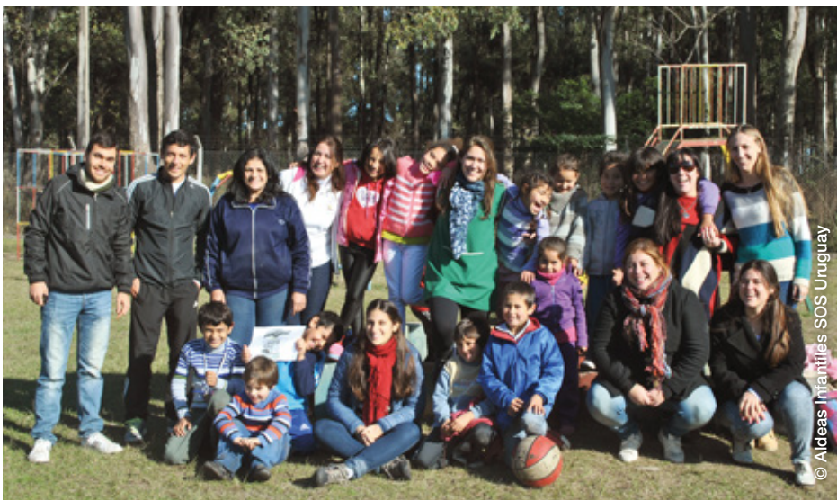
Equipo y participantes del Club de Niños