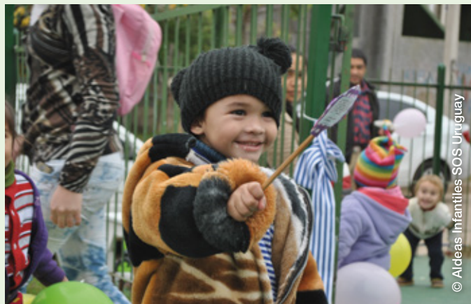
Inauguración del Caif Verdisol (Montevideo)