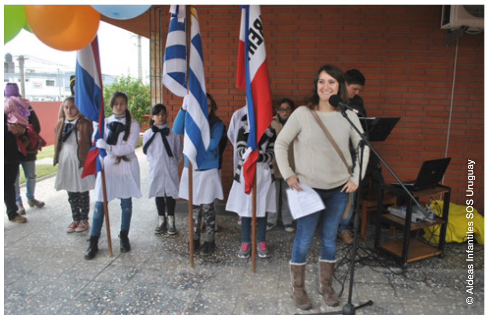
Inauguración del Caif La Paz (Canelones)

En lo que respecta a otros vínculos con el